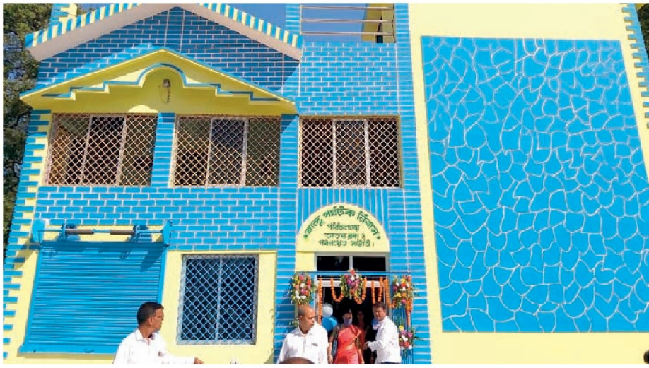
অযোধ্যা পাহাড়ে পর্যটক নিবাস।