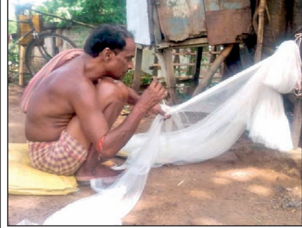
বাজি তৈরি ছেড়ে জাল বুনছেন বাজির কারিগর।

দেশের করোনা পরিস্থিতির কথা মাথায় রেখে এবং আদালতের নির্দেশ মেনে পশ্চিম মেদিনীপুরের ছেড়ুয়া গ্রাম বাজি তৈরি থেকে সরে এল। ফলে, এই প্রথম বাজিহীন 'বাজি গ্রাম' ছেড়ুয়া। বাজি তৈরি ও বিক্রি ছেড়ে গ্রামবাসীরা মন দিয়েছেন অন্য পেশায়। কেউ বুনছেন মাছ ধরার জাল, কেউ তৈরি করছেন শিশুদের দোলনা, পুতলা। বাজির কারিগররা বাস্তব একশো দিনের কাজে, নিজেদের চাষের জমিতে। মাছ চাষে। স্বস্তি ফেলেছে জেলা পুলিশ, প্রশাসন। ছেড়ুয়ার প্রতিটি ঘরেই সব ধরনের বাজি তৈরি হয়। উৎসবের আগে তাঁদের ব্যস্ততা বেড়ে যেত কয়েকগুণ। মেদিনীপুর শহর থেকে ৮ কিলোমিটার দূরে পিচকুড়ি পঞ্চায়েতের অধীন ছেড়ুয়া গ্রাম। ছেড়ুয়া ও বামুনডাঙ্গা দুই গ্রামে ১৭৬টি পরিবারের বাস। ফি বছর দীপাবলির পনেরো দিন আগে থেকেই গ্রামের প্রতিটি বাড়িতে চোখে পড়ত চরম ব্যস্ততা। বাজির বারুদের গন্ধে ভরে থাকত বাতাস। কমবেশি প্রতিটা বাড়ির উঠানে পড়ে থাকত তুর্ভির খোল, পটকা বানানোর সূতলি, রসবাতির কাগজ কিংবা তারাবাতির বারুদ। রোদে শুকানো হত বারুদে ঠাসা দেদমা, চকোলেট