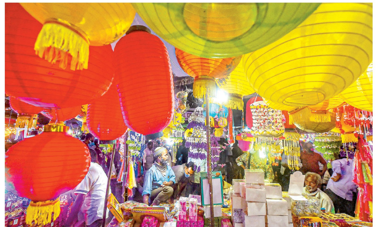
আলোয় আলো চর্চান চকের বাজার।